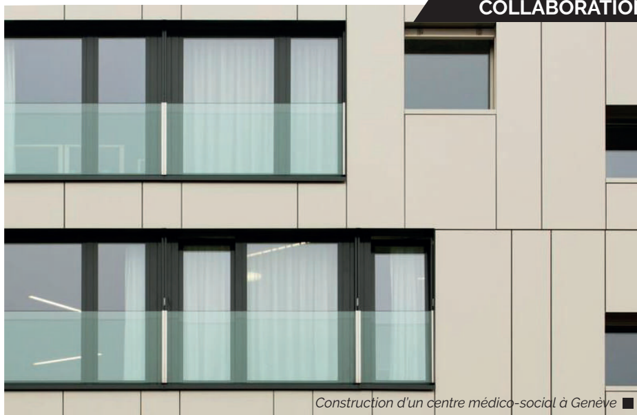
Construction d'un centre médico-social à Genève ■