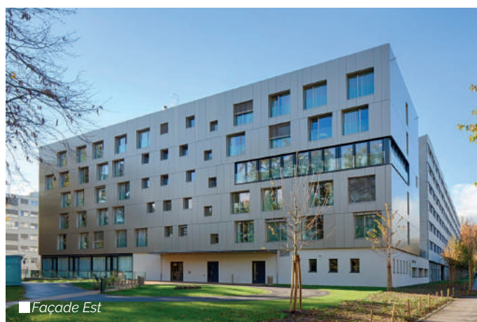
■ Façade Est

Des panneaux solaires placés sur la superstructure technique assurent le pré-chauffage de l'eau chaude sanitaire, le complément étant garanti par les chaudières à condensation.