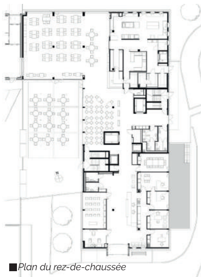
■ Plan du rez-de-chaussée