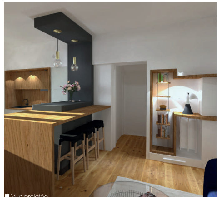
■ Vue projetée