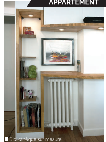
■ Bibliothèque sur mesure