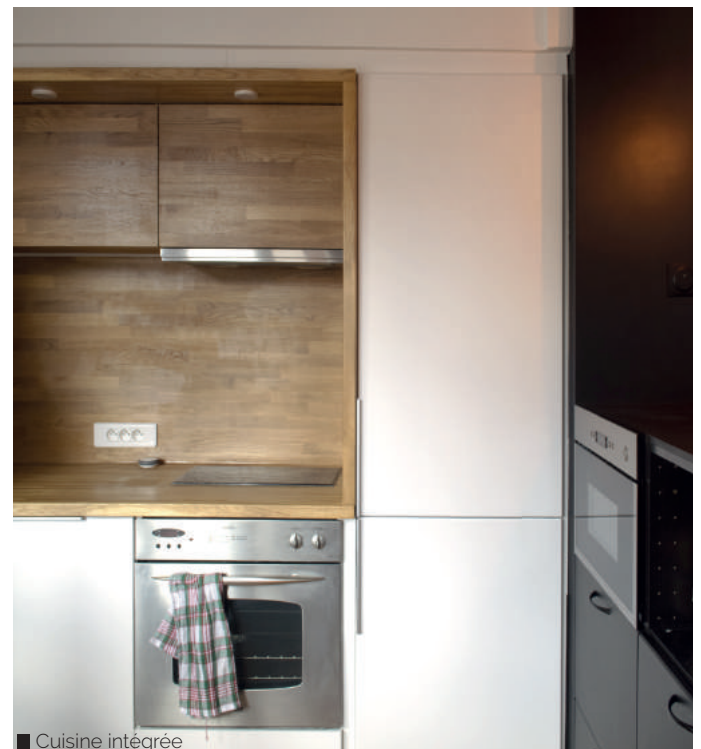
■ Cuisine intégrée